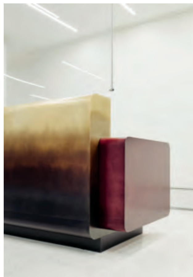
Rivestimento desk in finitura DeMarea su ottone Desk cladding in DeMarea finishing on brass