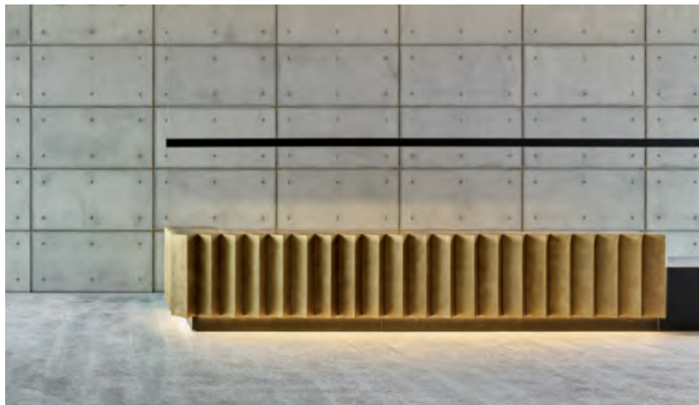
Bancone scultura in ottone finitura DeLabré Sculptural desk in DeLabré finishing on brass