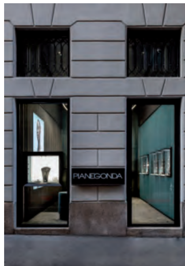
Rivestimento Scomposta in finitura De Marea su acciaio inox Scomposta wall cladding system in DeMarea finishing on stainless steel

The shop concept, designed by Stefano Sagripanti, is a clear demonstration of the main characteristics of the brand Pianegonda: organic shapes and essential architectural lines combined together. The strong feminine atmosphere that fills the space is enhanced by the Scomposta wall cladding system in custom DeMarea finishing by De Castelli. Blended shades obtained thanks to artisan but monitored oxidation techniques go from teal green to taupe. A clear reference to naturally smoothed stones emerges in a rigorous and essential mix of panels that create a balanced and harmonious result.