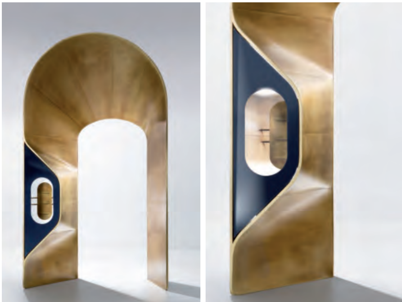
Portale in ottone finitura DeLabré Portal in Delabré brass

The expansion of the Almini boutique in Via Bagutta in Milan extends the spatial, formal and material choices of the small adjacent flagship store - designed by CZA as well - in line with the increasing product offer and the brand image. The role of an exhibition and sales space, like this, is similar to that of the sound box of a musical instrument capable of giving fullness and generating resonances around the melody produced by the strings. The background does not need to replace the object; on the contrary, it wants to be an "analogue" capable of arousing emotions and generating a system of connotations appropriate to its character and style. The new entrance in Via Bagutta takes the form of a round arch inscribed in the geometry of the existing portal; while its profile resonates with the motifs of the historical architecture of the district, the material and chromatic consistency of the oxidized brass reinterprets it in a contemporary way. Its sharp profile allows a complete view of the stone of the Neoclassical architrave, and its splay-which deforms on the left to create a single window facing the road-frames the glass door leading to the store. The theme of the oval-headed brass frame distinguishes not only the frames of the existing windows but also the exhibitors of the interior, and it is in perfect continuity with the best examples of architecture of the post-war shop, among them the splendid Manzoni Gallery and its large mirrors with rounded corners.