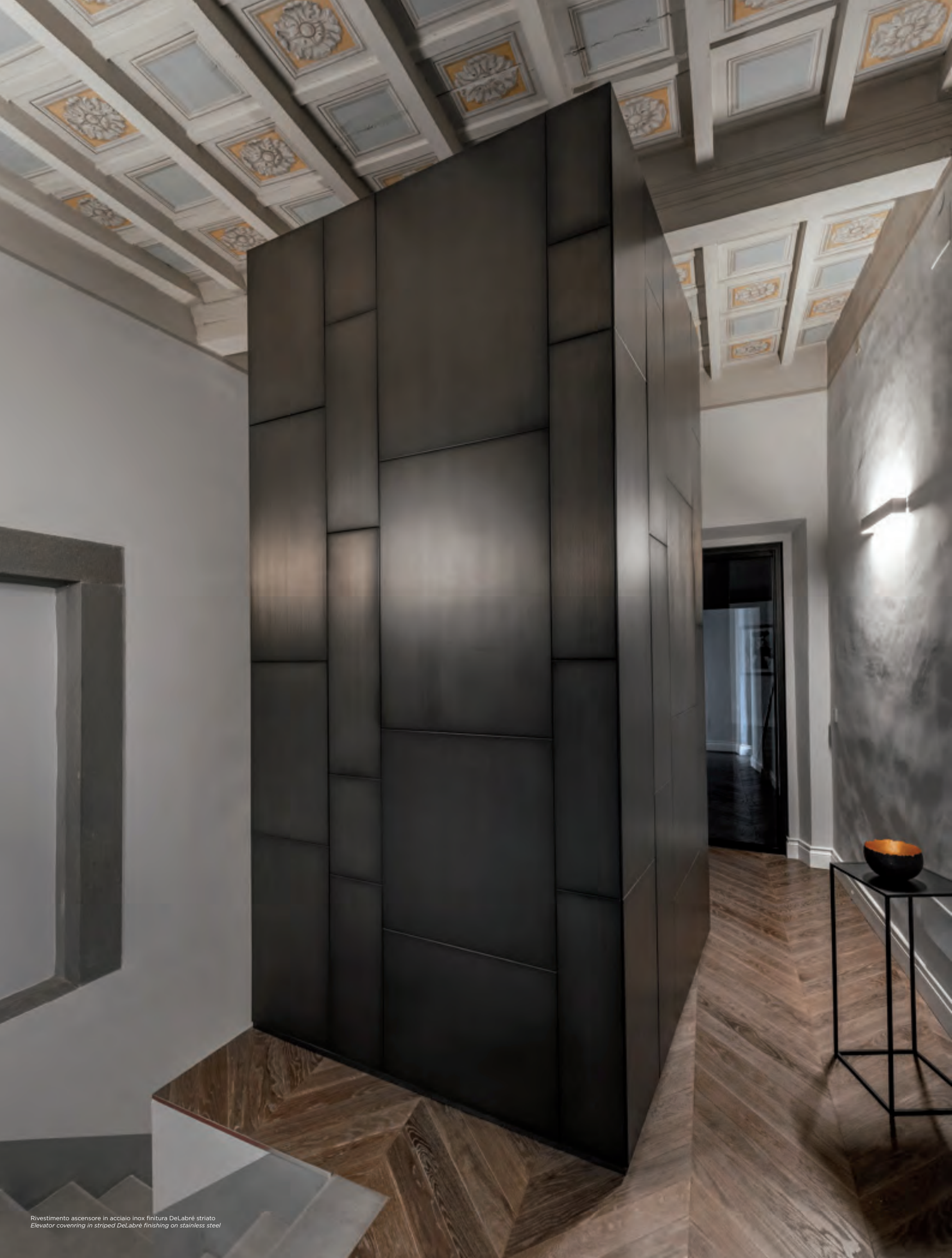
Rivestimento ascensore in acciaio inox finitura DeLabré striato Elevator covering in striped DeLabré finishing on stainless steel