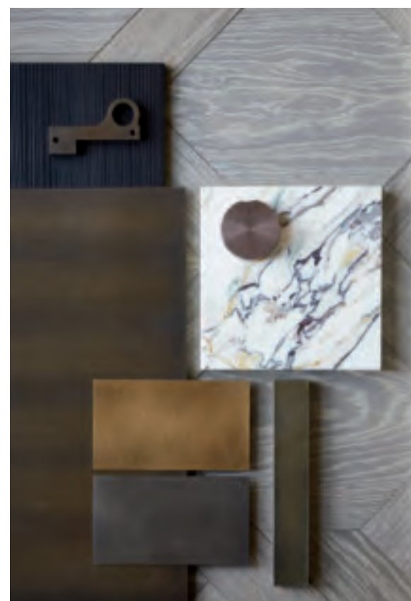
Rivestimento camino in ottone finitura DeLabré Boiserie on chimney in DeLabré finishing on brass

Elegant materials, pleasant textures and carefully studied details create a concept of living where functionality and personal style coexist. The meticulous attention to details and the manual execution of all finishing processes come out in the metal surfaces of De Castelli, used as architectural cladding. "A special haven of cosiness" describes the project of this elegant private home in Munich, within which the fireplace hood conveys a welcoming warmth and a vibrant, serene energy. The customized DeLabré finishing on brass, chosen for the fireplace and for the base of the dining table and especially created for this project, arouses visual and tactile emotions, which seamlessly blend in with the refined environment, reflecting the personality and individuality of its owners. The finishing perfectly suits the tones of DeLabré stainless steel which characterizes the boiserie of the living room.