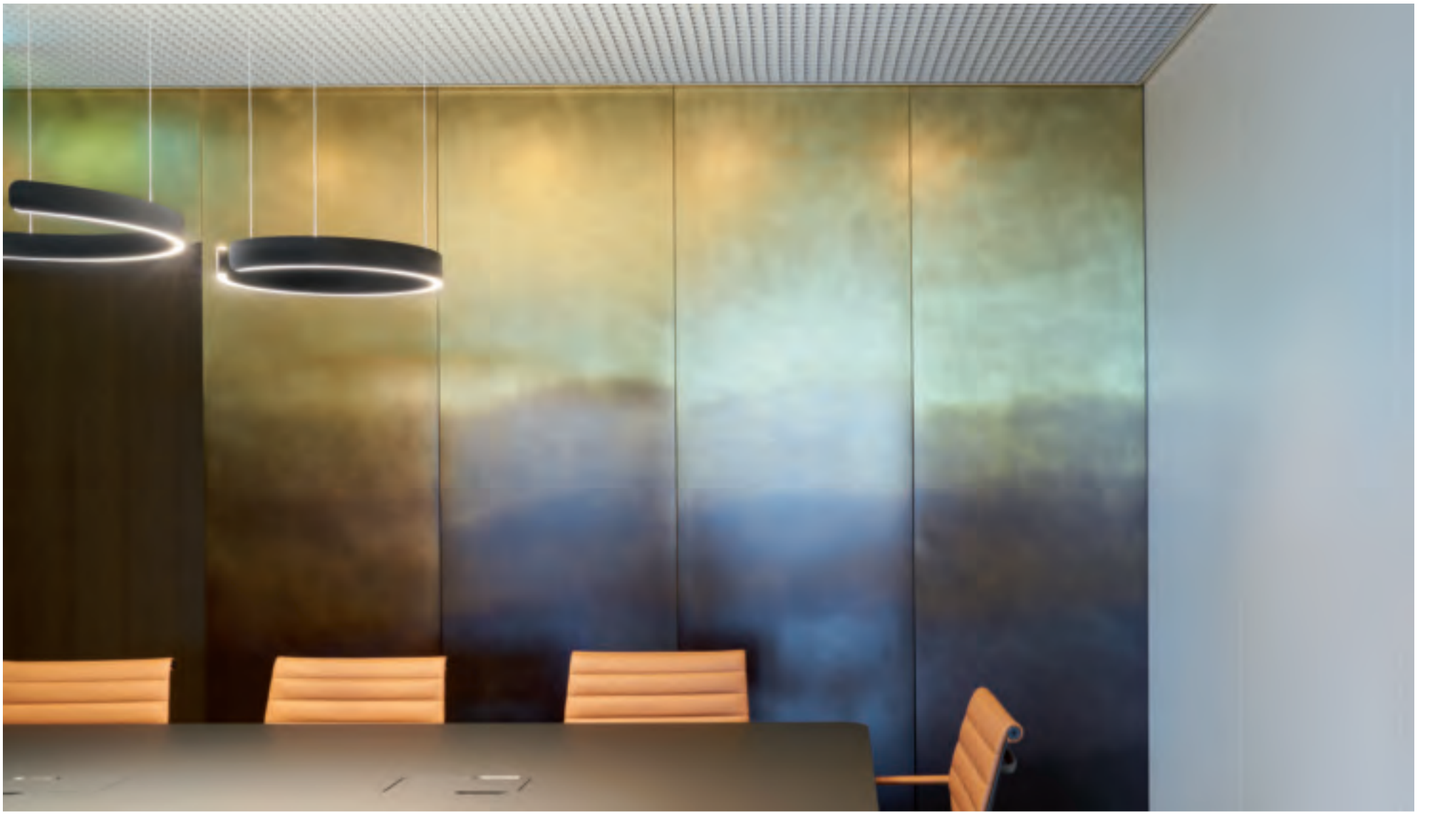
Parete scomposta in ottone finitura DeMarea Scomposta cladding system in DeMarea finishing on brass