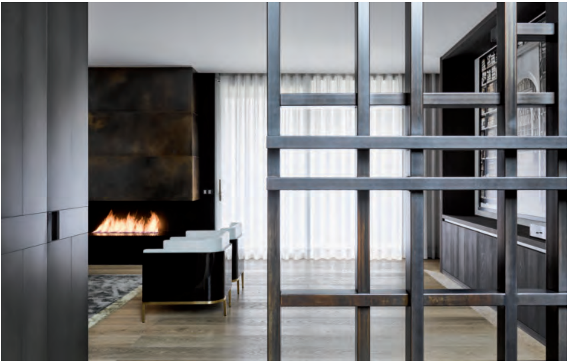
Boiserie e divisorio in acciaio inox DeLabré Boiserie and screen in DeLabré stainless steel