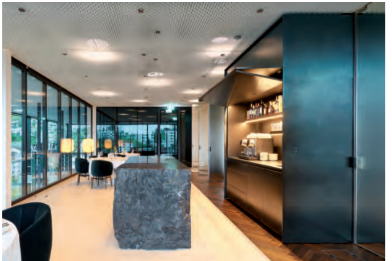
Angolo cottura rivestito in acciaio inox finitura DeMarea Kitchenette clad in DeMarea finishing on stainless steel