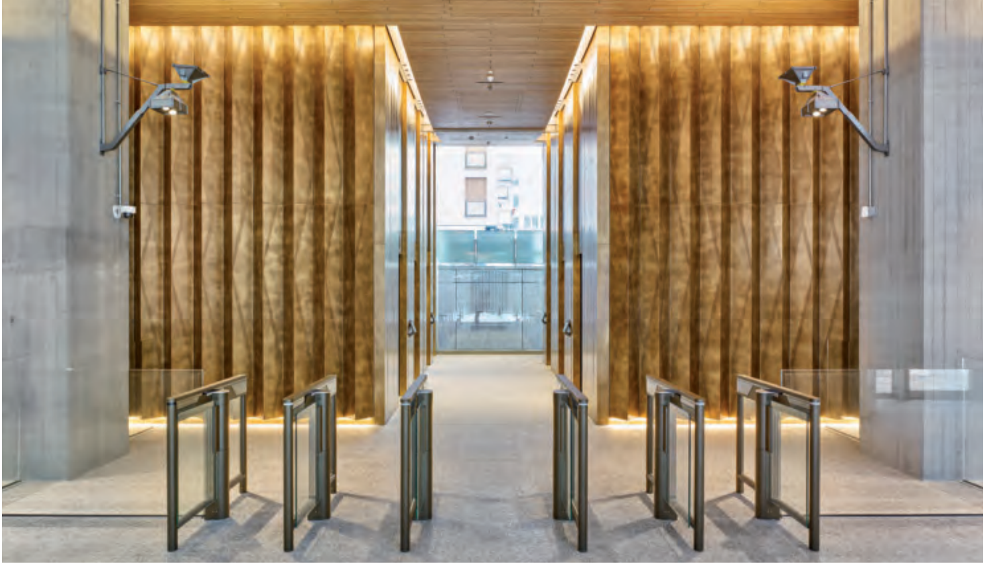
Rivestimento a parete in ottone DeLabré Cladding system in brass DeLabré finishing