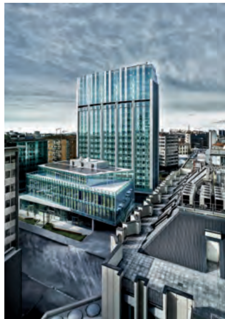
Corso Como Place

An important role is played in this project by the custom surfaces of De Castelli. The entrance lobbies and the reception desks enlightened by the DeLabré finishing on brass, applied with different shapes and details following the requirements of each space. The smallest lobby is characterized by a Scomposta cladding system with regular panels and a wooden desk with a minimal and clean metal shape. The main lobby presents a rhythmic wall cladding with "V" panels, overlapped and microperforated, made on request on the architects' project drawings basis. The microperforated finishing is not only aesthetic but also functional, as it acts as a sound-absorbing structure. A similar rhythm was applied to the desk too, where the brass cladding in DeLabré finishing, the leitmotiv of this project, produces a 'zigzag' effect. The 400 sqm of wall cladding also include the lifts cladding, internally and externally, with another custom pattern developed by De Castelli with DeErosion technique.