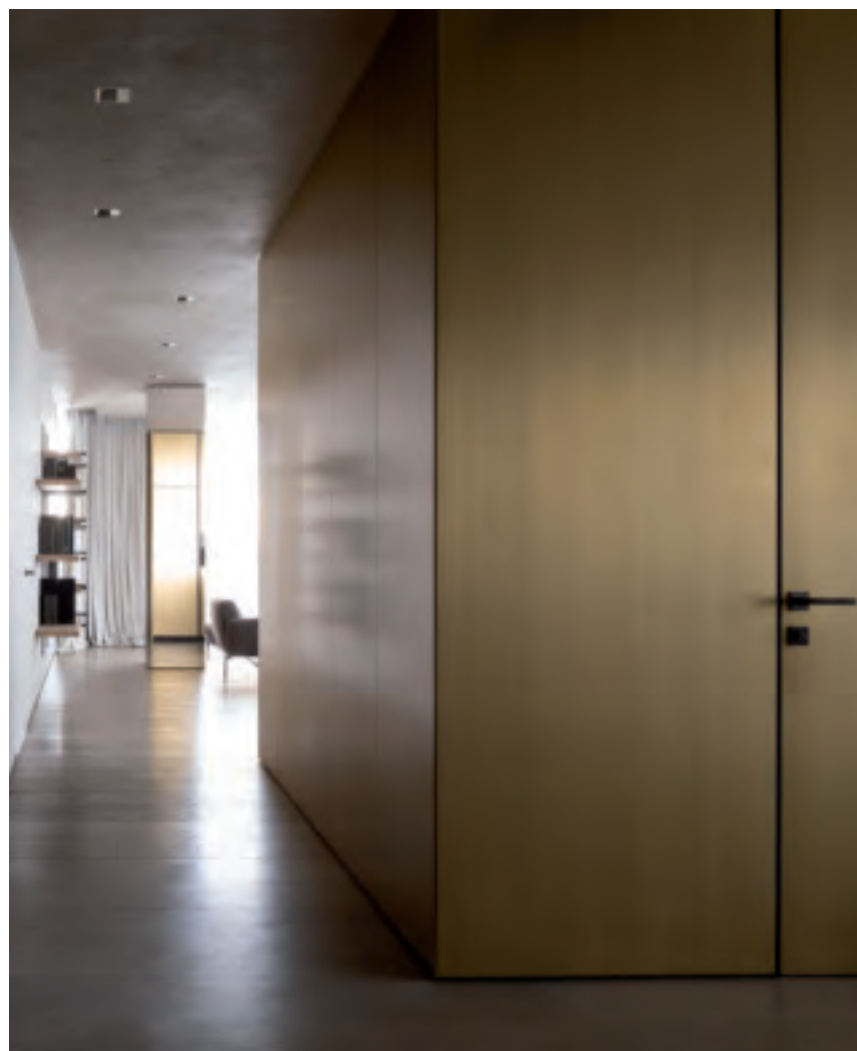
Rivestimento Boiserie in ottone satinato Boiserie cladding system in satin brass

De Castelli handcrafted finishes give the metal surfaces a special character, able to interpret the personality of the environment of which it becomes an integral part. The brass cladding in satin finish selected for the interiors of this refined apartment in Moscow dialogues with the environment around reflecting its bright and lively mood. Refined and timeless, the atmosphere has no boundaries: the project is characterized by a fluent style, from the kitchen to the living area in a harmonious continuity. The wonderful Xila kitchen covered in satin finished brass is the result of our established partnership with Boffi, that has selected some exclusive metal finishes by De Castelli for their kitchens.